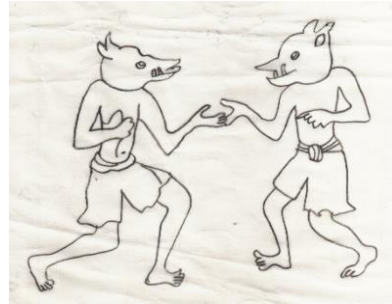
شكل (٤) قوم جزيرة سكسار