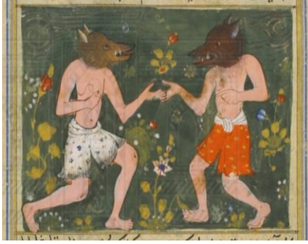
اللوحة (٨) قوم جزيرة سكسار - بالورقة (١٥٣ وجه) - لم يسبق نشرها.