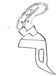
شكل (٣) خوذة