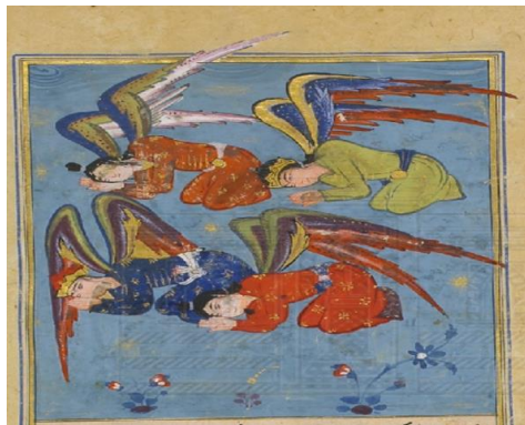
اللوحة (٦) أربعة من الملائكة الساجدين - بالورقة (٦٦ظهر) - لم يسبق نشرها.