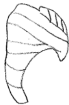
شكل (٧) عمامة متعددة الطيات