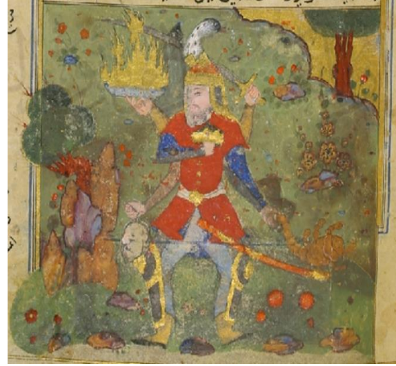
اللوحة (١) كوكب المريخ - بالورقة (٢٢وجه) - لم يسبق نشرها.