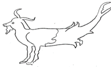
شكل (٢) برج الجدي