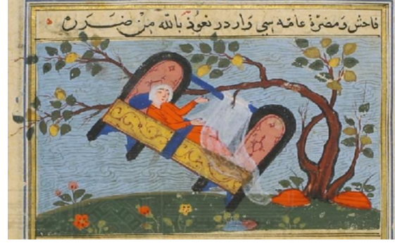
اللوحة (٧) سيل بولاية الشام - بالورقة (٢٨ وجه) - لم يسبق نشرها.