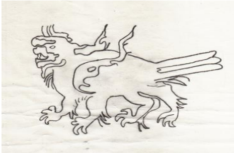
شكل (٥) قيطس