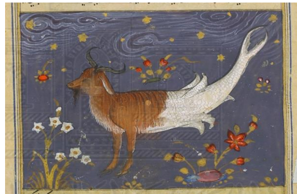
اللوحة (٥) كوكبة الجدي - بالورقة (٦٤وجه) - لم يسبق نشرها.