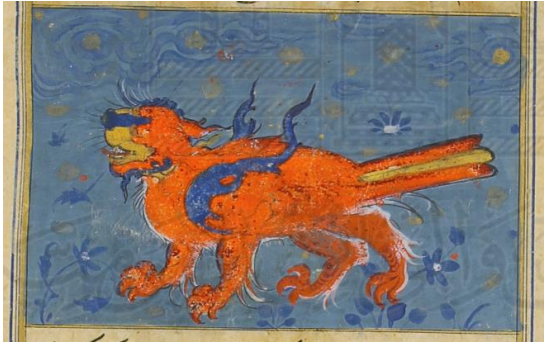
اللوحة (٤) كوكبة قيطس - بالورقة (٧٤ظهر) - لم يسبق نشرها.