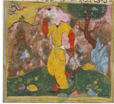
اللوحة (٣) كوكبة حامل رأس الغول - بالورقة (٣٨ظهر) - لم يسبق نشرها.