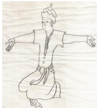
شكل (٦) كوكبة الجاثي على ركبتيه