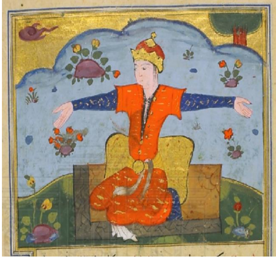
اللوحة (٢) كوكبة الجاثي على ركبتيه - بالورقة (٣٧وجه) - سبق نشرها.